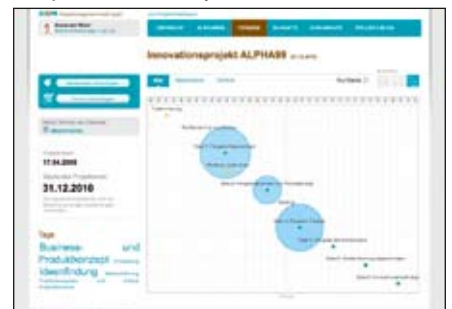
TERMINE. Definition und Planung von Projekt-Meilensteinen.